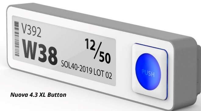
Nuova 4.3 XL Button